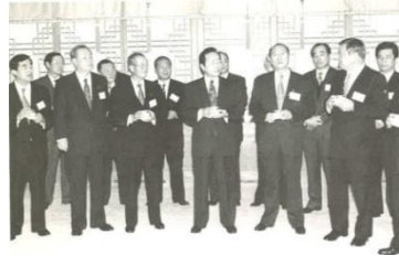
대통령 초청 간담회 1993.3.11