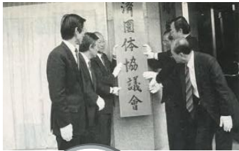
경단협 창립 1989 12.23