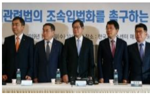
경제관련법의 조속한 입법화 촉구 2019.11.6