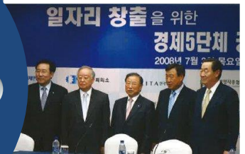
일자리 창출을 위한 경제5단체 공동대책 2008.7.4