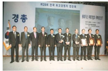
제1회 투명경영대상 시상식 2005.1.26